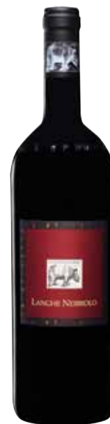
LA SPINETTA LANGHE NEBBIOLO