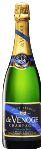
DE VENOGÉ CORDON BLEU

ÅRGÅNG: NV URSPRUNG: Champagne, Frankrike VARUNR: 77141 PRIS: 299 kr LANSERING: 2009-11-02 Beställningssortimentet